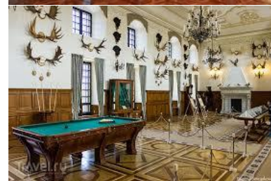
Экскурсия на целый день