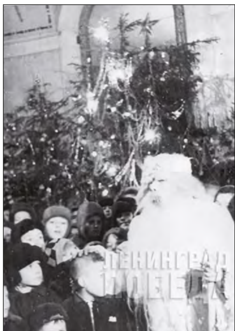
На Новогоднем празднике в театре им. Пушкина. 06. 01. 42 г.

Фотографии и детские дневники рассказывают о детских праздниках новогодней елки в детских садах, школах и театрах. Обязательной частью которых был обед и маленький подарочек с печеньем или пряником, а кому-то даже достался мандарин. Одна из школьниц писала о новогодней елке: «6 января 1942 г. Сегодня была елка, и какая великолепная! Правда, я почти не слушала пьесы: все думала об обеде. Обед был замечательный. Дети ели медленно и сосредоточенно, не теряя ни крошки. Они знали цену хлебу, на обед дали суп-лапшу, кашу, хлеб и желе, все были очень довольны. Эта елка надолго останется в памяти».