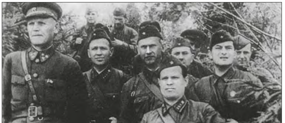
М.Шолохов, А.Фадеев, Е.Петров в гостях у командующего Западным фронтом генерал-лейтенанта И.С.Конева (крайний слева)