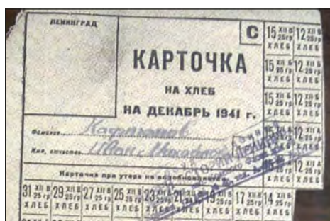
Карточка на хлеб. Потерять ее означало умереть.

Люди пекли печенье из столярного клея и сдирали со стен обои, чтобы съесть клейстер.